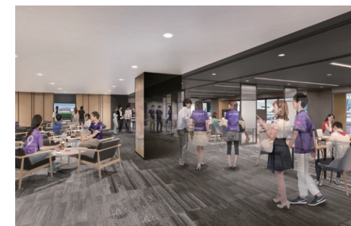
※画像はイメージです。今後変更になる場合があります。

プレミアムテラスラウンジ使用权付 10 「プレミアムテラスラウンジ」の使用が可能で、ビュッフェスタイルの食事やドリンクをお楽しみいただけます。