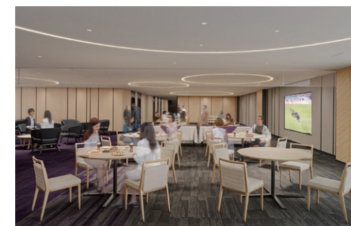
※画像はイメージです。今後変更になる場合があります。

プレミアムVIPラウンジ使用权付 10 「プレミアムVIPラウンジ」の使用が可能で、ビュッフェスタイルの食事やドリンクをお楽しみいただけます。