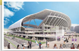
※イメージ写真は今後変更 となる場合があります。